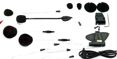
※シングルパックの同梱品

●BT X2プロSは、フルフェイスヘルメット用のワイヤマイクと、オープンフェイス用のアームマイクを同梱。ヘルメットを買い替えてもマイクを追加購入することなく使い続けられるのは有り難い